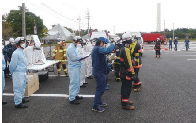
避難指示区域内における大規模火災対応訓練におけるスクリーニング活動