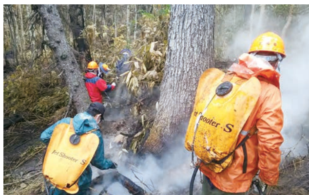
人力による消火活動