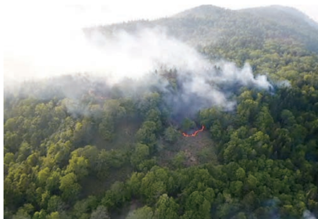
令和元年5月 北海道雄武町で発生した林野火災