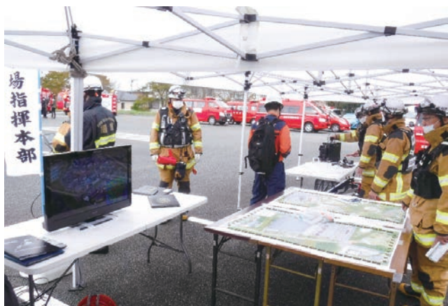
避難指示区域内における大規模火災対応訓練におけるドローン映像を活用した指揮活動